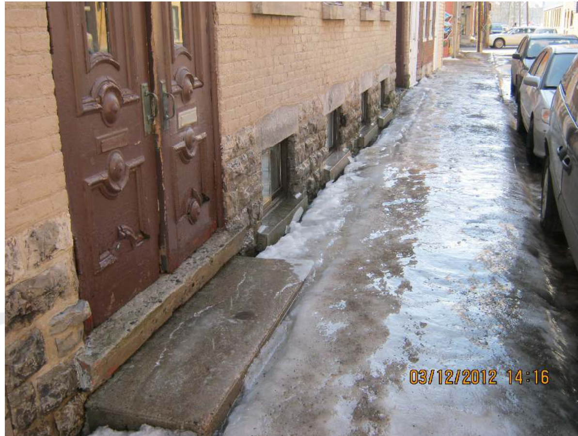
Glace formée par l'eau d'une toiture qui dégoutte sur le trottoir