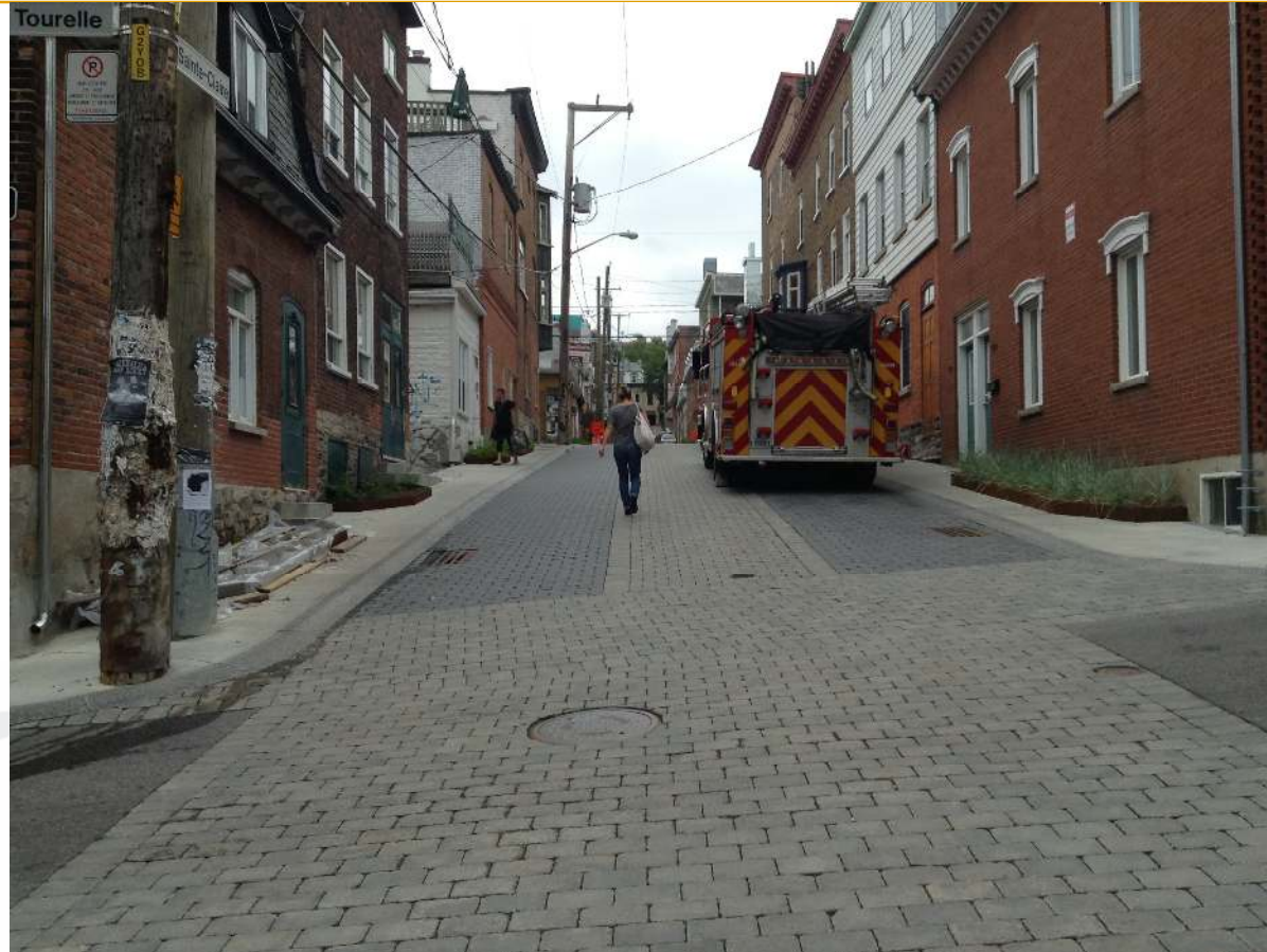
Rue à chaussée partagée avec la bande centrale pour marquer le passage pour piéton