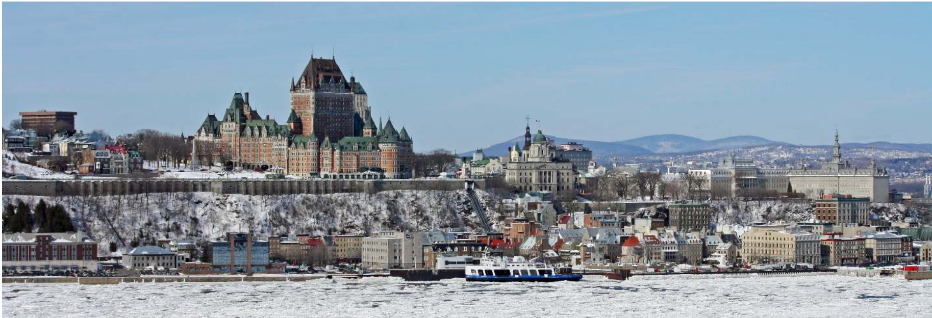
Québec en hiver, vue de la rive sud du fleuve Saint-Laurent