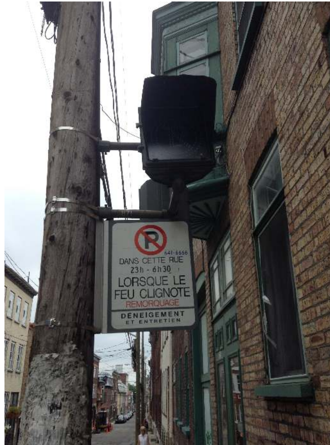
Feu clignotant pour déneigement